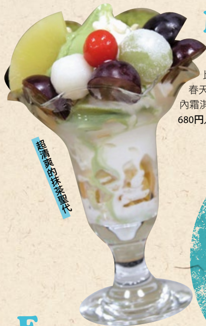
超清爽的抹茶聖代