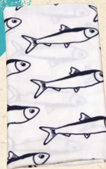
樣式超甜美的桃子手拭巾