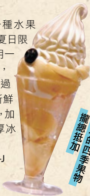
日本的四季果物 擔總添加

每月推出一種水果聖代，白桃為夏日限定，大方地使用一整顆白桃製作，吃起來非常過癮。而且除了新鮮果肉還有果凍，加上CREMIA濃厚冰淇淋超速配。 1,296円/FRUIT-J