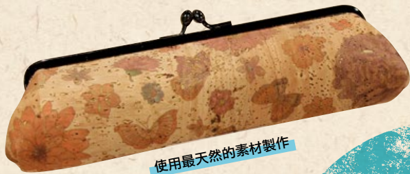
使用最天然的素材製作