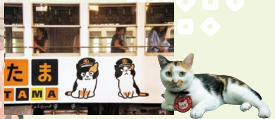
小玉路面電車-岡山電氣鐵道株式會社