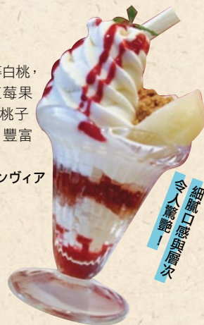
細膩口感與層次 令人驚艷！

嚴選岡山在地上等白桃，搭配白桃霜淇淋、紅莓果醬、兩種餅乾，還有桃子慕斯、扶桑花果凍，豐富的口感超乎想像。 1,000円/ホテルグランヴィア岡山 オリビエ