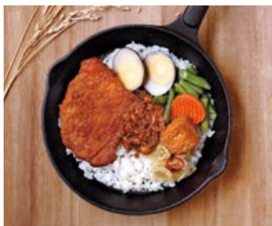
圖片僅供參考，餐點依季節性調整，以機上提供為主。