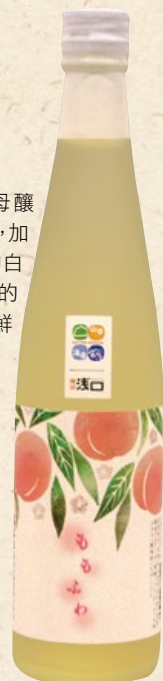
輕柔的蜜桃香 在舌尖綻放