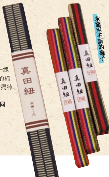
永遠用不斷的繩子