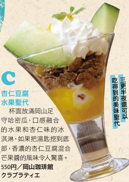
三更半夜還可以 吃得到的美味聖代

杯面放滿岡山足守哈密瓜，口感融合的水果和杏仁味的冰淇淋，如果把湯匙挖到底部，香濃的杏仁豆腐混合芒果醬的風味令人驚喜。 550円/岡山珈琲館クラブラティエ